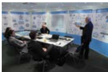
Figura 1. Workshop sobre a nuvem da HPE em ação