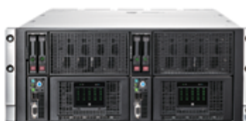
HPE ProLiant SL4540 (2 nœuds de serveur dans un châssis 4.3U)