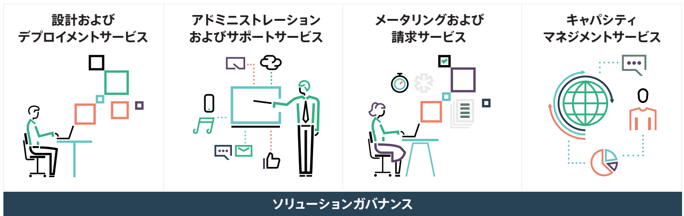
図2. パブリッククラウドのシンプルさ、アジリティ、および優れた経済性にオンプレミスのHadoop環境のセキュリティとパフォーマンスのメリットを組み合わせて提供