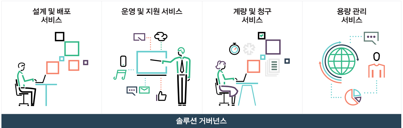
그림 2. 단순하고 민첩하며 경제적인 퍼블릭 클라우드의 장점과 온프레미스 Hadoop 환경의 보안과 성능 장점을 모두 제공합니다.